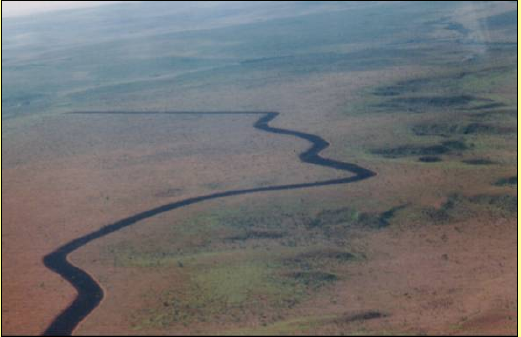
Línea negra en el Parque Nacional de Emas, Brasil