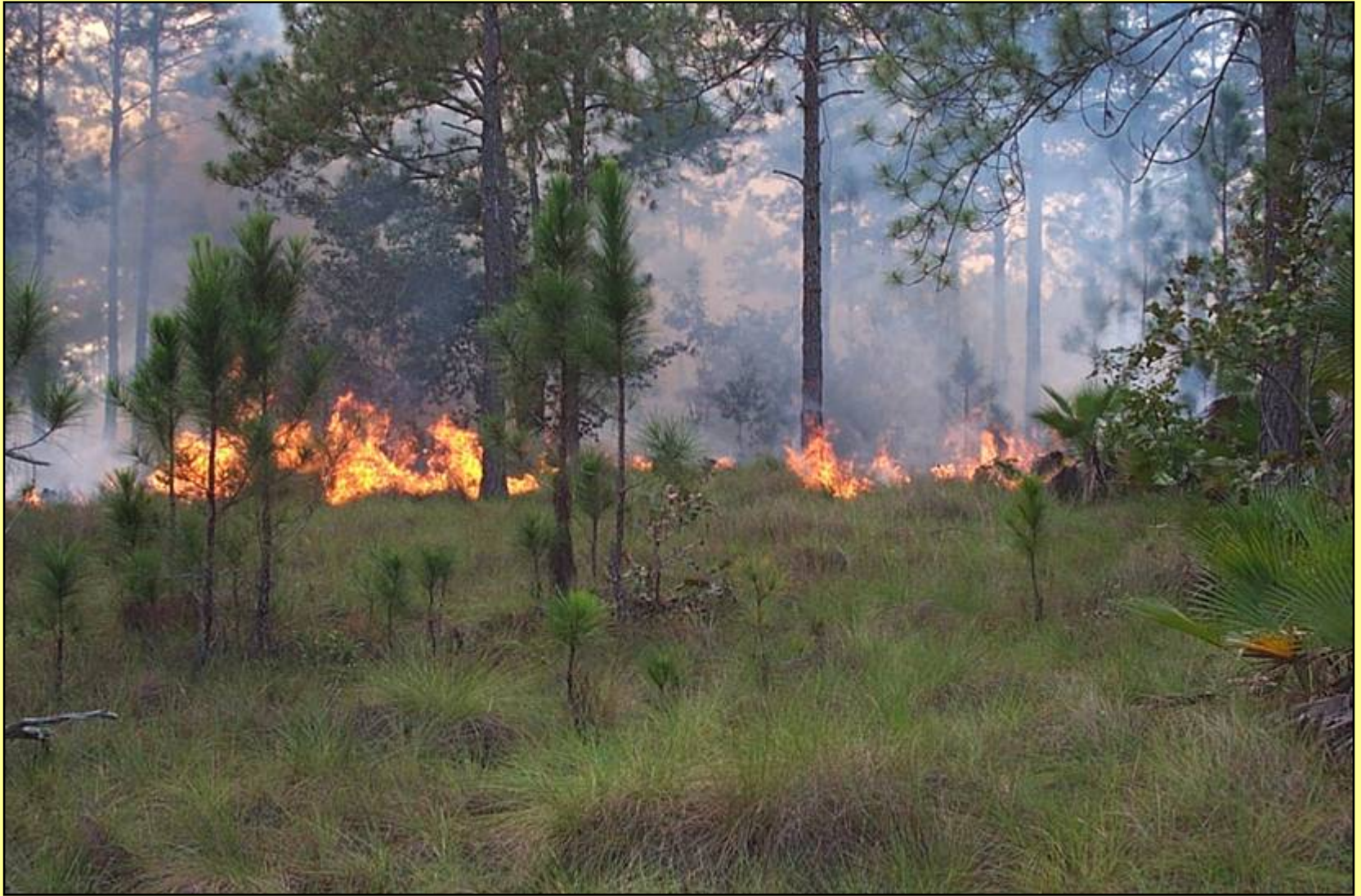
Quema prescrita para mantener a los pinares de Pinus caribea en Belice